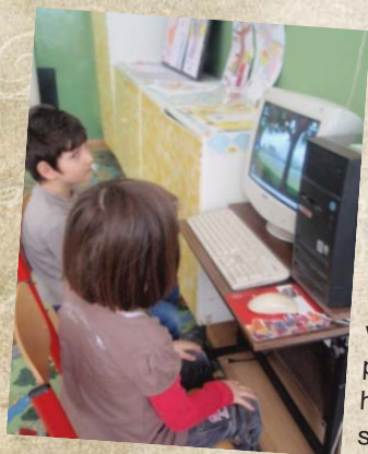
ZŠ Slovenský Grob, želaní detí v škole. Sen: Mať v triede 2 počítače, hoci aj staršie